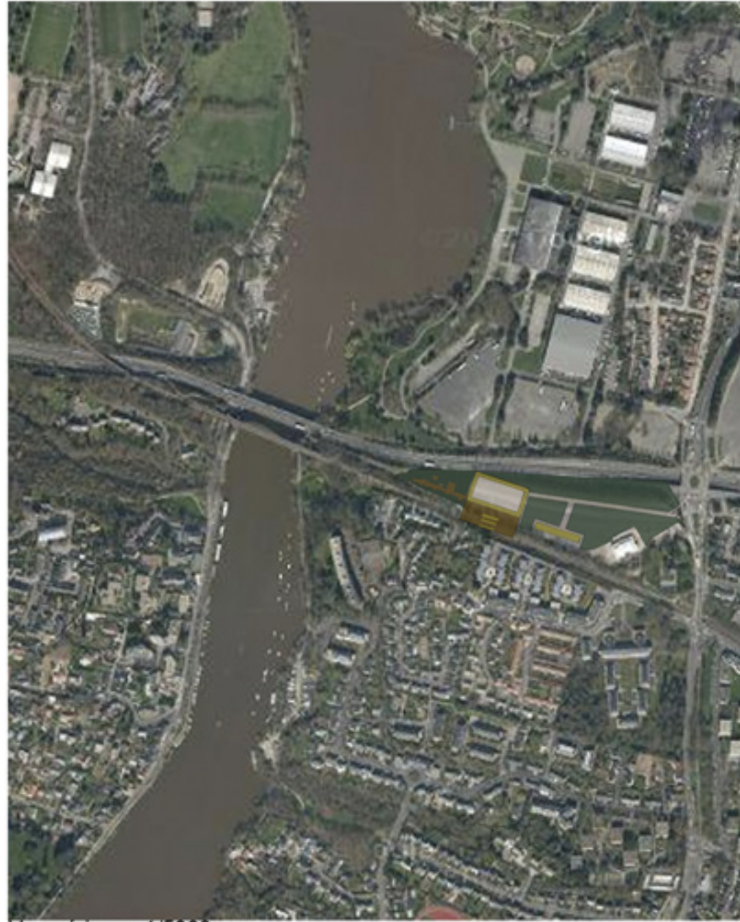
Vue aérienne 1/5000

Créer un projet en lien avec la zone NL du PLU, suite à l'étude de l'aménagement des rives de l'Erdre. (Respect des réglementations du PLU : le bâti ne dépasse pas la hauteur de la végétation)