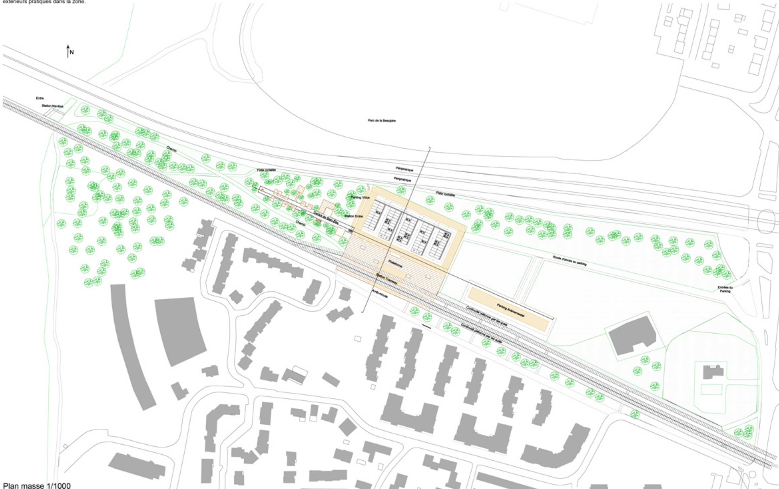
Plan masse 1/1000

- Centre de Bien-Etre : P+R Pause + Relaxation. Disposer des cabanes dans la végétation existante au plus proche de la nature (donc sans emprise au sol) Offrir un dépaysement rapide et facile d'accès, une pause liée au changement de transport, parmi les flux marquants de ce site. Permettre un observatoire sur le cadre naturel à la fin du parcours