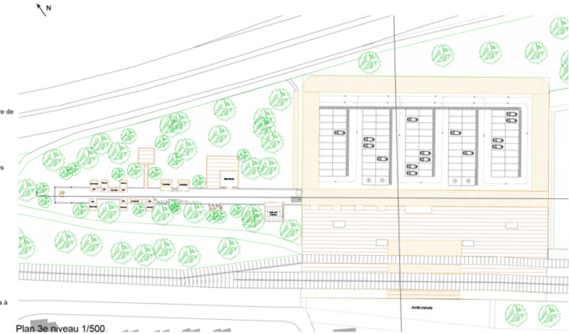
Plan 3e niveau 1/500