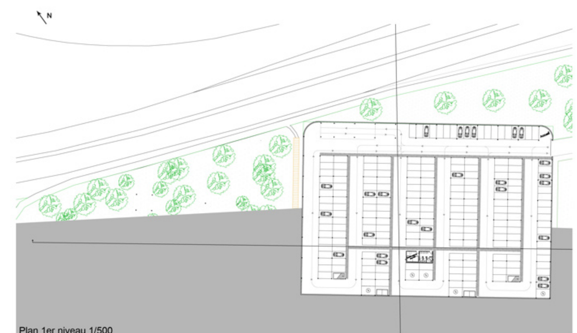
Plan 1er niveau 1/500